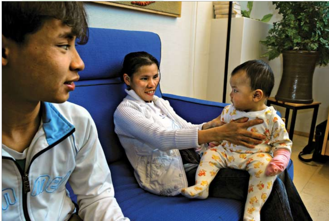
Burmalaiset tutustuvat suomalaisen saunakulttuurin kirkossa.

Vantaan evankelis-luterilaiset seurakunnat haluavat toivottaa tervetulleiksi kaikki Hakunilan alueelle eri puolilta maailmaa muuttaneet ihmiset. On tärkeää, että jokainen löytää oman paikkansa ja tuntee olonsa kotoisaksi.