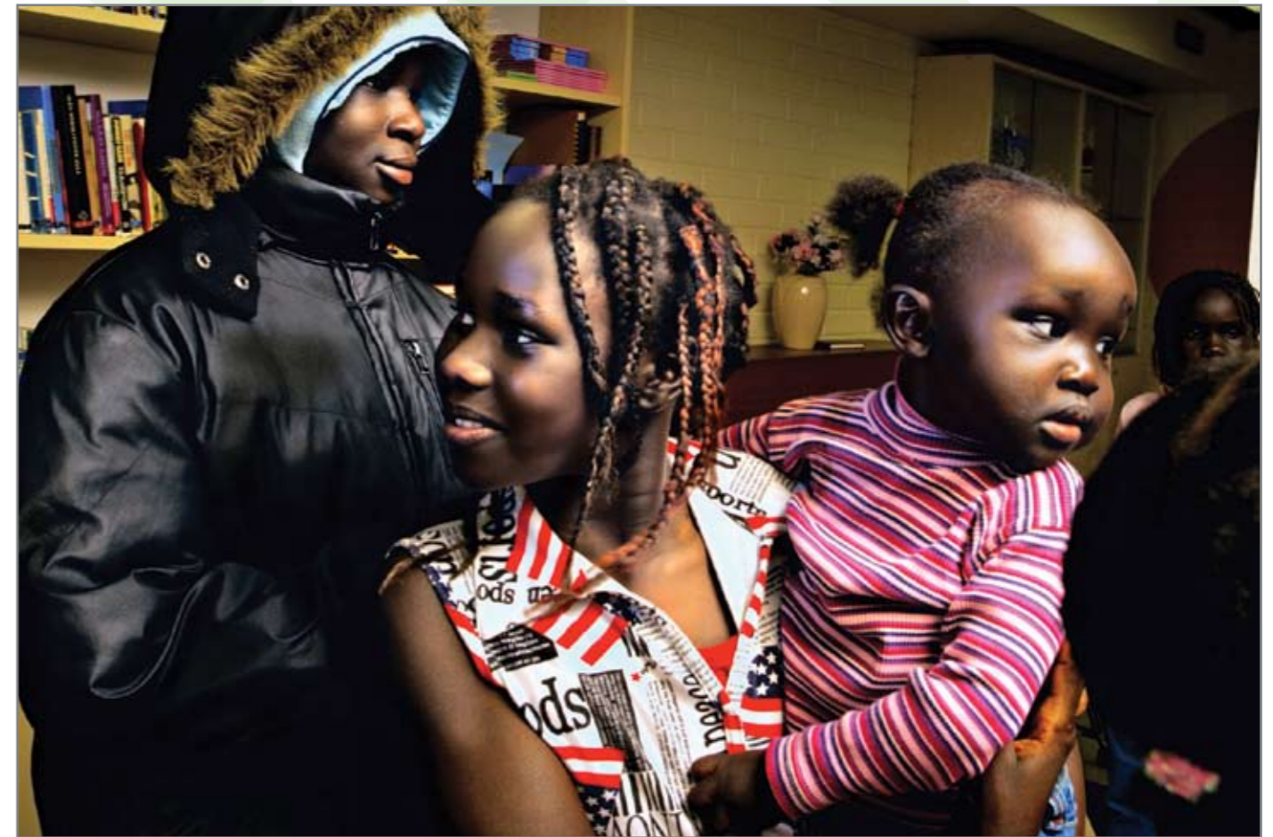
Sudanilaiset kokoontuvat joka viikko kirkon tiloissa.

Luterilaisten seurakuntien toimintaa pääkaupunkiseudulla on tarjolla myös viroksi, venäjäksi, arabiaksi ja kiinaksi. Toiminnasta kerrotaan osoitteessa www.migrantchurch.fi