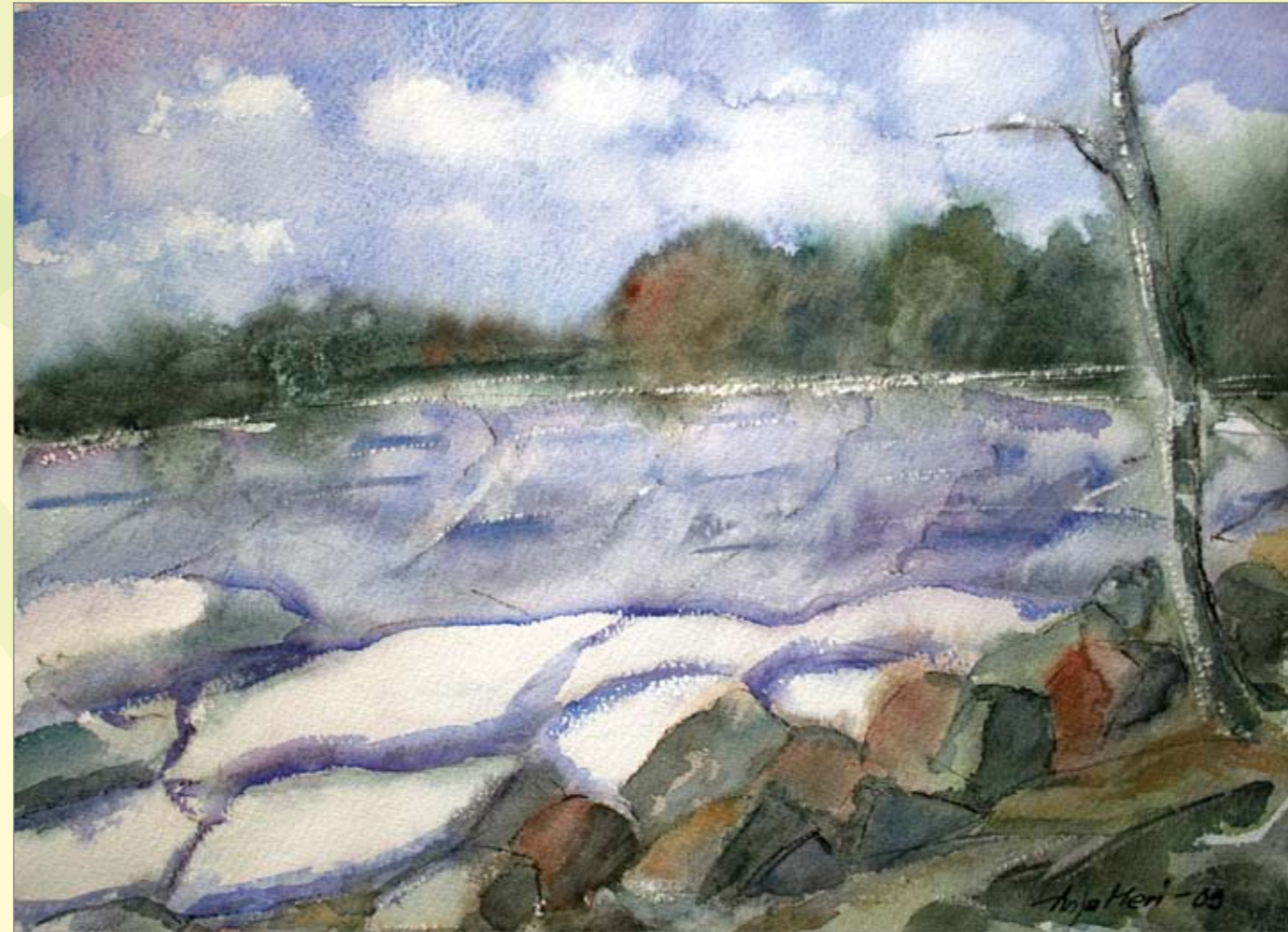
Anja Meri. Talvimaisema, akvarelli 2010.

Vaikka työni on välillä uuvuttavaa, koen sen kuitenkin